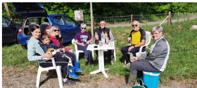
Moment de convivialité