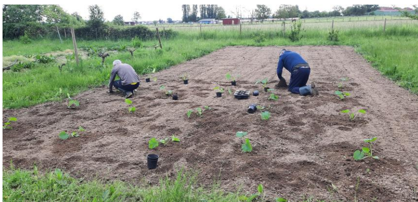
Plantation des salades et courgettes