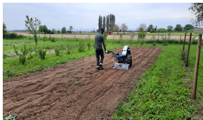
Nettoyage et préparation