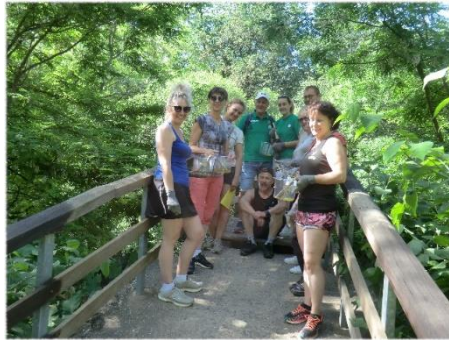
Rafraîchissement du pont des 12 Moulins