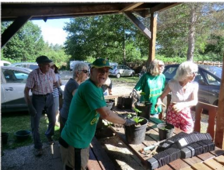
Ateliers à la ferme pédagogique des Coucous