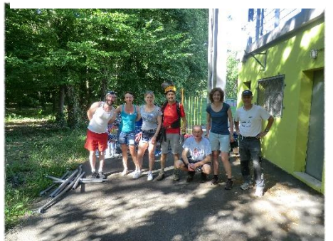
Travaux d'entretien au stade