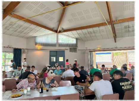
Repas à la salle polyvalente