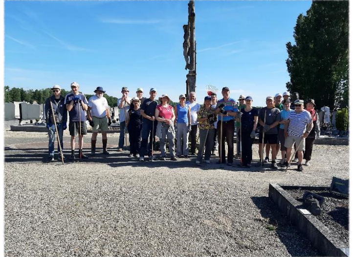
Aménagement et désherbage au cimetière