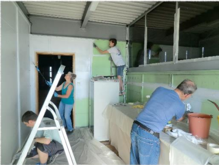
Travaux à l'église Saint-Jean