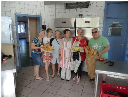
Intendance à la salle polyvalente