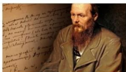
Les Frères Karamazov de Fiodor DOSTOÏEVSKI

Les Amis de la bibliothèque vous invitent à leur Café lire mensuel :