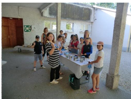
Ateliers avec les enfants