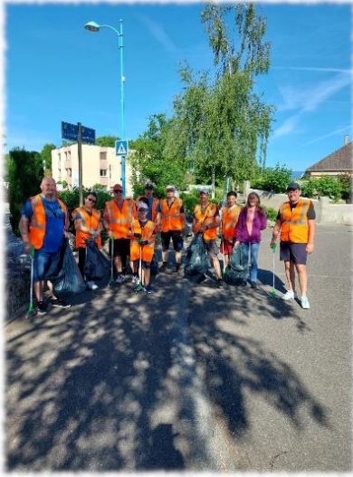
Nettoyage du ban communal