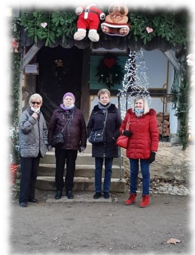
Sortie Ecomusée du 14 décembre