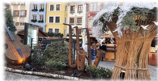
Sortie du 7 décembre au marché de Noël de Mulhouse