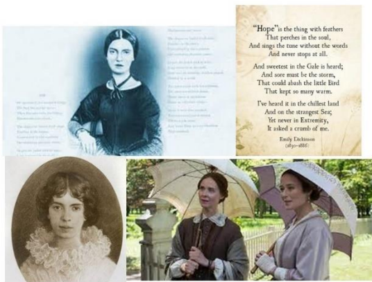
Emily DICKINSON Poète américaine