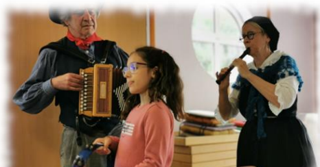
Repas d'automne du mois d'octobre avec nos seniors : belle ambiance