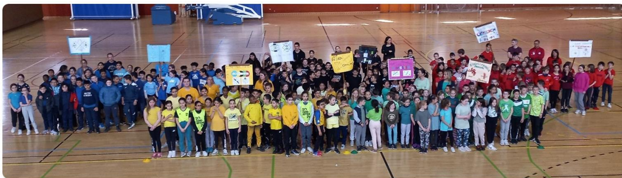
Nos élèves sont au premier rang à droite de la photo

Ce superbe projet a été mené par m2A, les associations sportives locales et l'Education Nationale, pour promouvoir le sport et les valeurs de l'olympisme, dans le cadre de la semaine nationale Olympique et Paralympique, en vue des J.O. de 2024. De nombreux ateliers ont été organisés sur toute la semaine pour les écoliers de m2A.