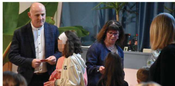
Remise des prix : Maisons Fleuries