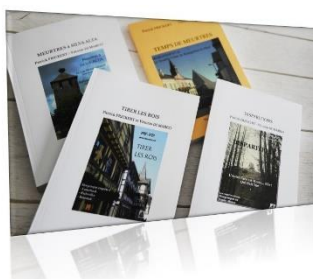
Polars régionaux à quatre mains