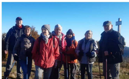
Balade vers le LAUCHENKOPF/UFF RAIN/SALZBACH du 14 octobre 2021

Pour celles et ceux qui souhaitent bénéficier d'un service d'accompagnement (courses - Pharmacie - rdv médicaux etc....) vous pouvez contacter madame Foehrenbacher en journée ou laisser un message au 07 50 54 90 41 .