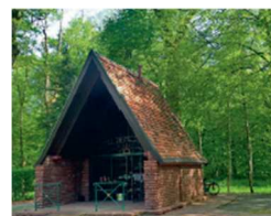
Chapelle Notre Dame du Chêne

Tous les déplacements se feront en covoiturage