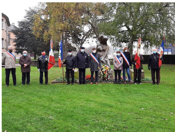
De gauche à droite sur la photo

La Marseillaise a été entonnée à capella et avec beaucoup d'émotion par les participants à ce vibrant hommage.